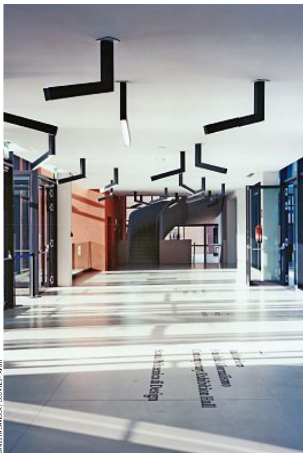
ERNESTA CAVIOLA / COURTESY AF517

| C'è fermento del mondo universitario milanese. I nuovi istituti pubblici e privati sono poli d'avanguardia. E anche belle architetture, in alcuni casi pensate per dare smalto alle periferie. Come la cittadella scientifica che sorgerà sull'area Expo / The world of Milanese higher education is in ferment. New public and private institutes are now operating on the cutting edge, housed in fine buildings, which in some cases are intended to enhance the city's outskirts. Like the citadel of science that will be created on the former site of the Expo